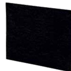
پیش تصفیه + کربن اکتیو