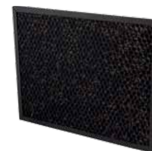
فرمالدهید + گرانول کربن